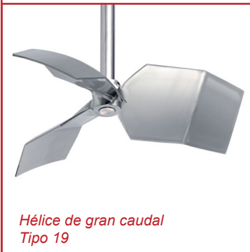
Hélice de gran caudal Tipo 19