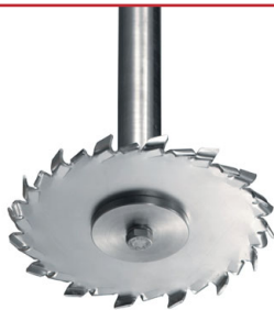
Turbina con dientes de sierra

Agitador vertical. Obturación mediante V-ring y retén. Soporte de rodamientos. Fijación de la hélice al eje y del eje al semieje mediante prisioneros allen. Motor IEC B14, 1500 rpm, IP 55, aislamiento clase F. Potencia máxima 0,75 kW. Hélice Lineflux (Tipo 18).