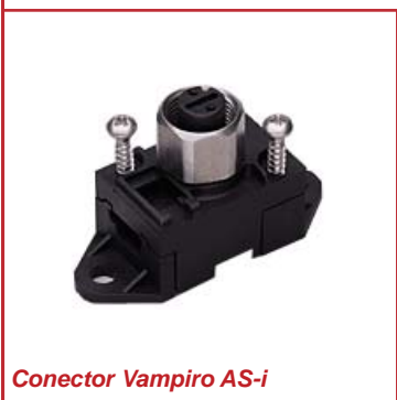
Conector Vampiro AS-i