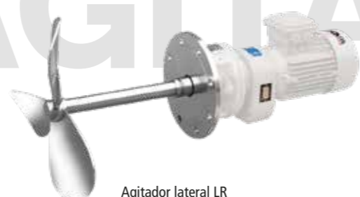
Agitador lateral LR LR side-entry agitator