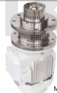
ME-6100 Mixer de fondo Tank bottom mixer