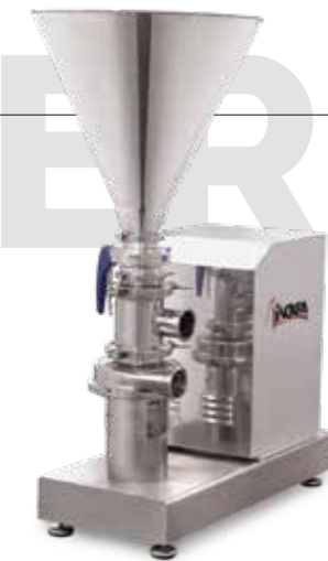
Gama M M series