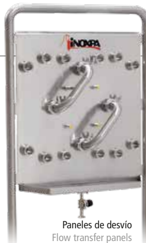
Paneles de desvío Flow transfer panels