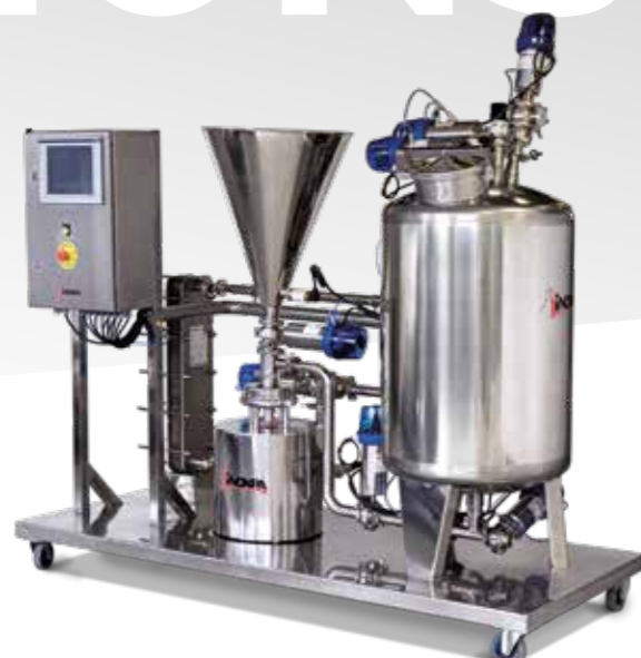
Sistema de mezcla sólido-líquido automatizado Automated solid-liquid mixing system