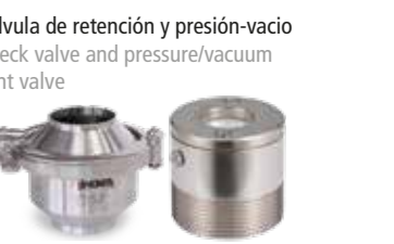
Válvula de retención y presión-vacío Check valve and pressure/vacuum vent valve