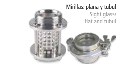
Mirillas: plana y tubular Sight glasses: flat and tubular