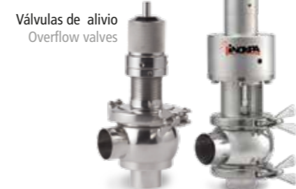
Válvulas de alivio Overflow valves