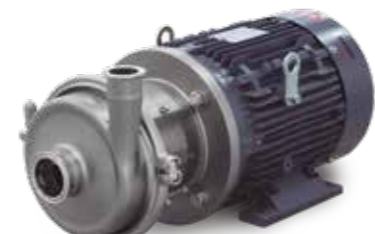
Hyginox SEN (NEMA)