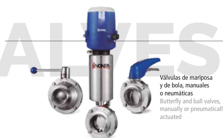
Válvulas de mariposa y de bola, manuales o neumáticas Butterfly and ball valves, manually or pneumatically actuated