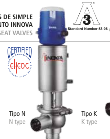
Tipo N N type