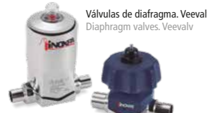
Válvulas de diafragma. Veevalv Diaphragm valves. Veevalv