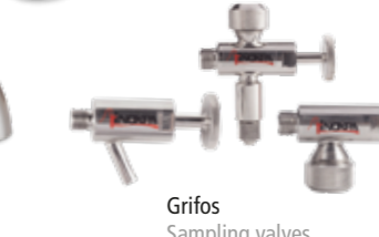
Grifos Sampling valves