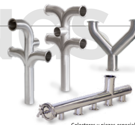
Colectores y piezas especiales Collectors and customized items