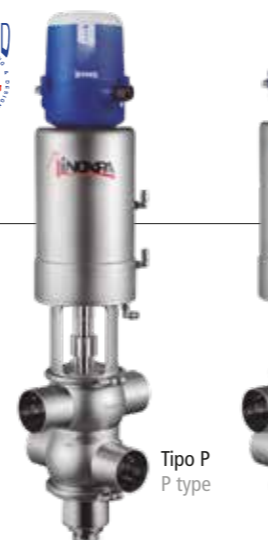
Tipo P P type