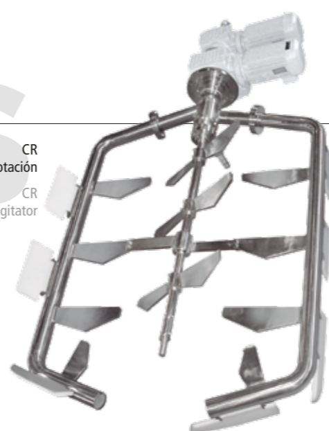
AGC con ánora AGC with anchor