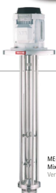
ME-1100 Mixer vertical Vertical mixer