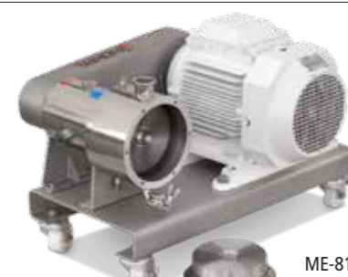
ME-8100X Multidientes Multitooth mixer