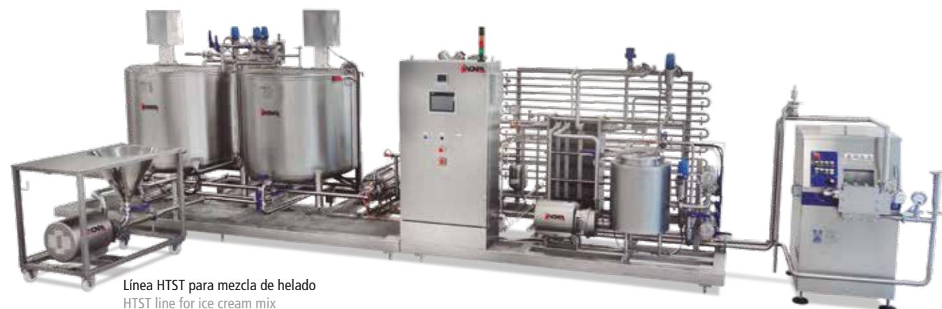
Línea HTST para mezcla de helado HTST line for ice cream mix