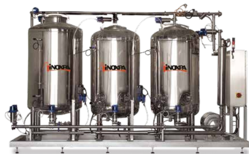
Sistema de limpieza CIP CIP system

MCR. Skid with counter-rotating agitator and mixer. Preparation of highly viscous products at a controlled temperature and pressure