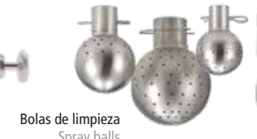
Bolas de limpieza Spray balls