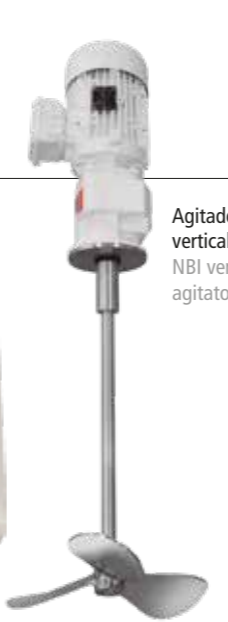
Agitador vertical NBI NBI vertical agitator