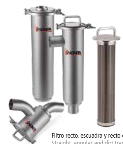
Filtro recto, escuadra y recto corto Straight, angular and dirt trap filter