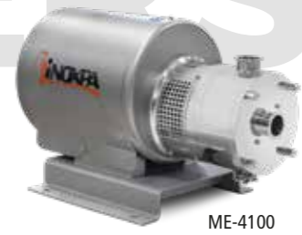
ME-4100 Mixer en fondo In-line mixer