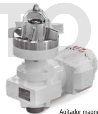
Agitador magnético Magnetic agitator