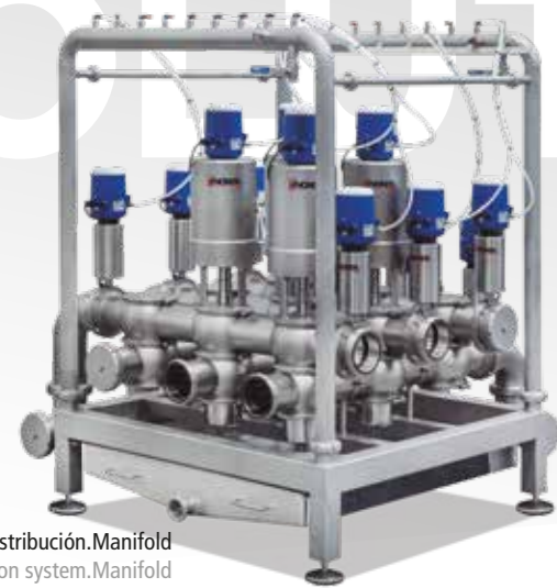
Sistema de distribución. Manifold Distribution system. Manifold