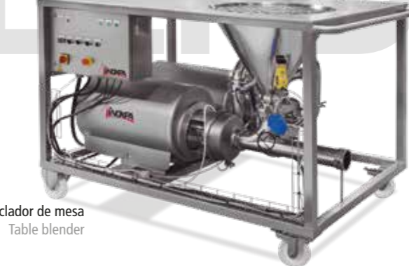
Mezclador de mesa Table blender